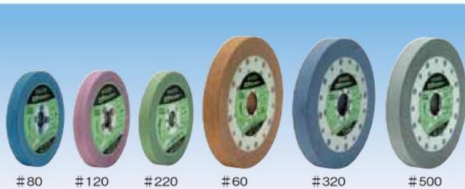
#80 #120 #220 #60 #320 #500